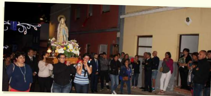
Recuerdos de los actos religiosos de las Fiestas Patronales de 2018