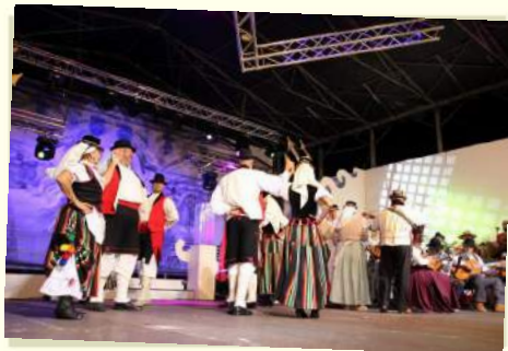
Recuerdos de la Exaltación de la Mujer y Homenaje a los Mayores 2018