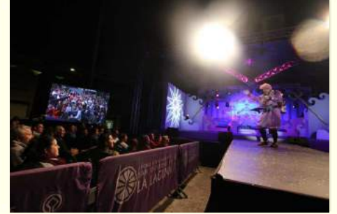
Recuerdos de la Gran Gala de las Fiestas Patronales de 2018