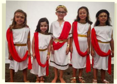
Recuerdos de la Gala Infantil de las Fiestas 2018