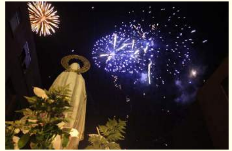
Recuerdos de las Fiestas Patronales 2018