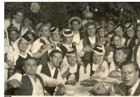
[3] Magos, grupo ateneo de La Laguna 1928 colección Melo Dait.

El 6 de Julio de 1990 [4], La Delegación de Fiestas y el Gabinete de Animación Sociocultural del Ayuntamiento de La Laguna organizan el primer baile de magos con la participación de la Agrupación Folklórica San Benito, El grupo Brisas del Monte y La Agrupación Folklórica Universitaria. En él se intentó rememorar los juegos, costumbres y entretenimientos relacionados con los antiguos Bailes de Candil. La plaza del Adelantado se engalanó para la ocasión. Para acceder al recinto era indispensable vestir con la indumentaria tradicional, las parrandas fueron las encargadas de aportar la música al baile.