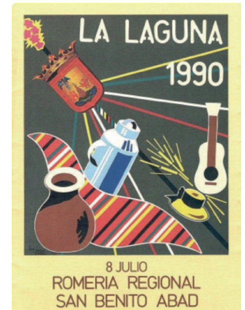
[4] cartel de la fiesta de San Benito Abad 1990.

El 6 de Julio de 1990 [4], La Delegación de Fiestas y el Gabinete de Animación Sociocultural del Ayuntamiento de La Laguna organizan el primer baile de magos con la participación de la Agrupación Folklórica San Benito, El grupo Brisas del Monte y La Agrupación Folklórica Universitaria. En él se intentó rememorar los juegos, costumbres y entretenimientos relacionados con los antiguos Bailes de Candil. La plaza del Adelantado se engalanó para la ocasión. Para acceder al recinto era indispensable vestir con la indumentaria tradicional, las parrandas fueron las encargadas de aportar la música al baile.